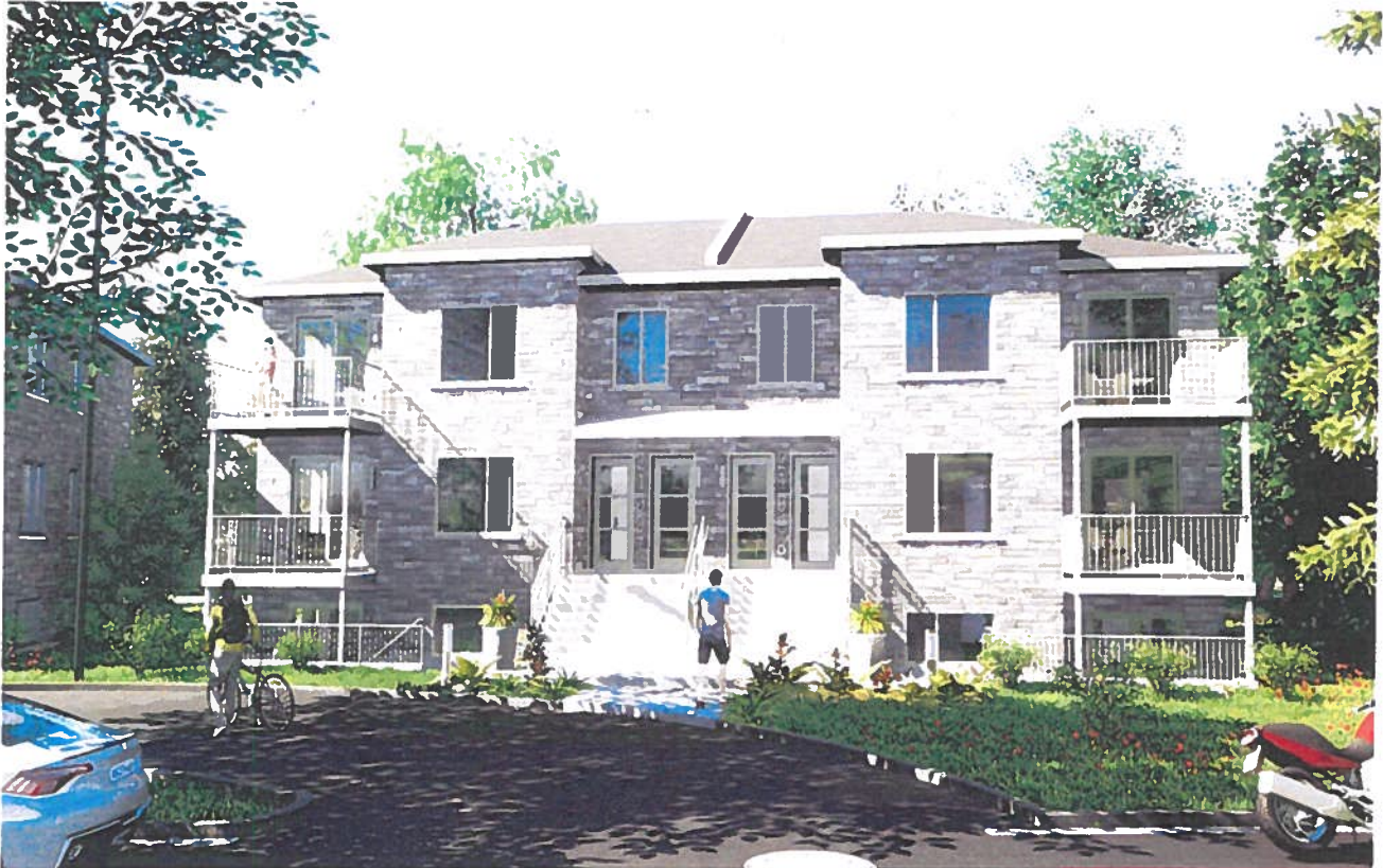
ANNEXE E.27 Article 1 du règlement 2022-1431-18A